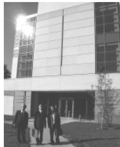
NIST Analytical Chemistry Division 棟正面にて