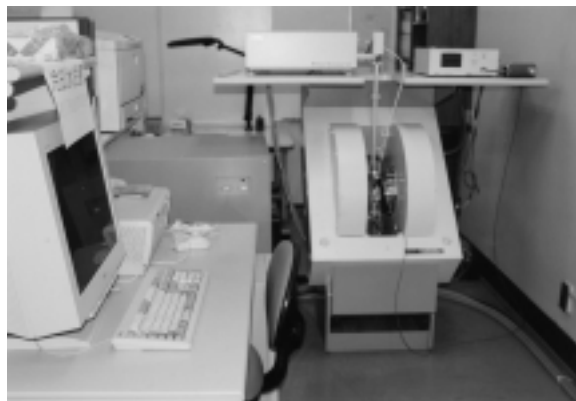
ESR(電子スピン共鳴装置)