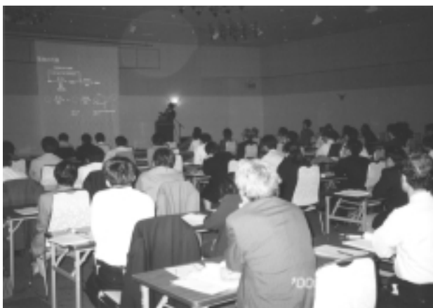
所内研究発表会聴講風景

ポスター発表は、業務に関連した内容の発表が4題、CNC(Create the New CERI)活動に関する発表が6題の計10題発表されました。(企画・野村)